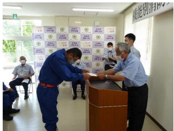
消防団長から辞令を交付しました