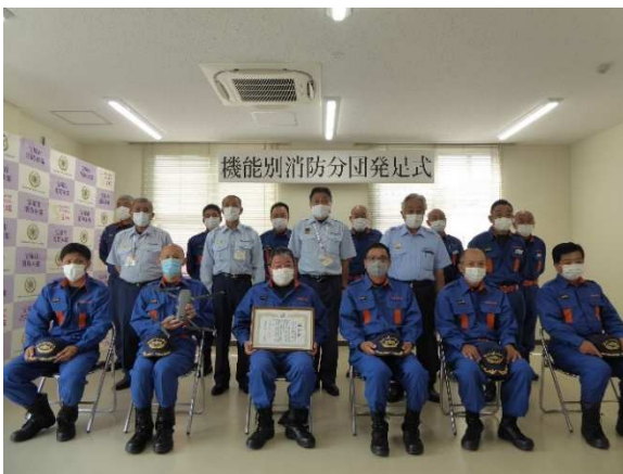
機能別消防団員の皆さん（前列）