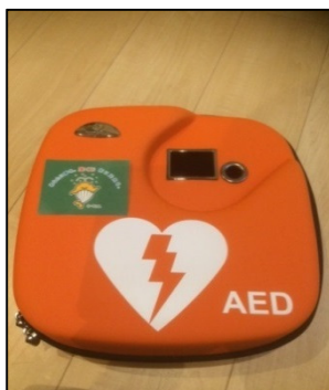
A E D