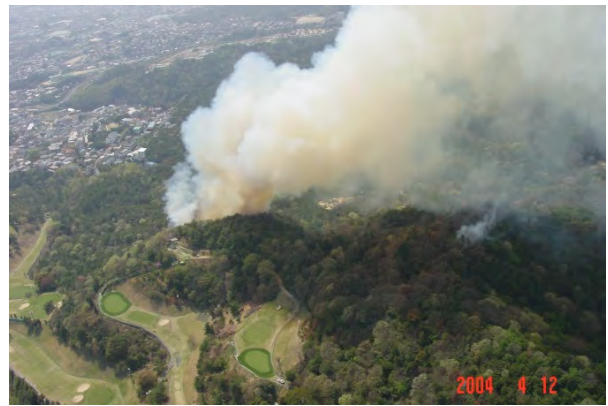
平成16年4月12日発生(宝塚市)