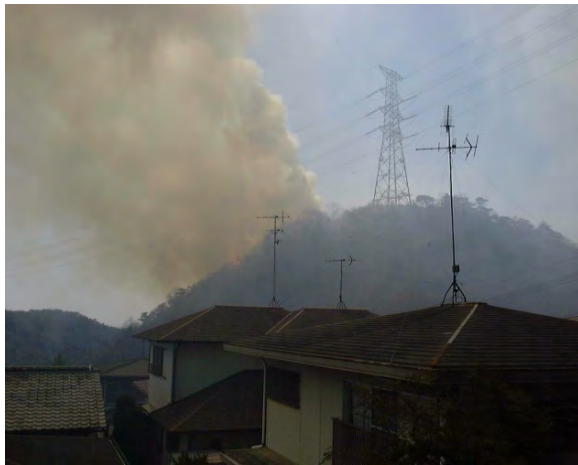
平成14年3月19日発生(宝塚市)

実施期間中、入山口付近において火災予防広報、広報車や消防車両による警戒パトロールを実施します。（宝塚市では期間を延長して実施します。）